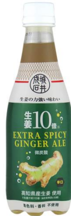
生姜 10 倍エクストラスパイシージンジャーエール 270 円