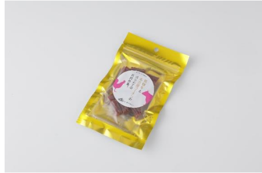
飛騨牛と名古屋コーチンの初めての共同作業。 1,200円