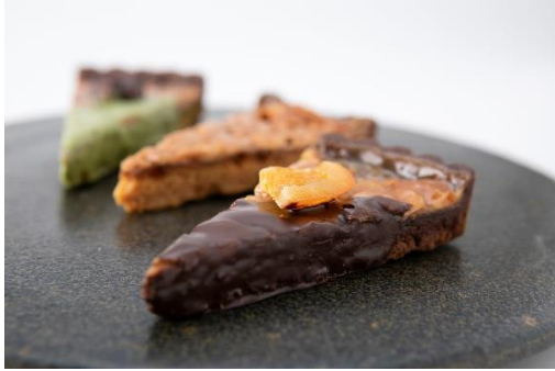
florentin tarte(全 3 種) 各 450円