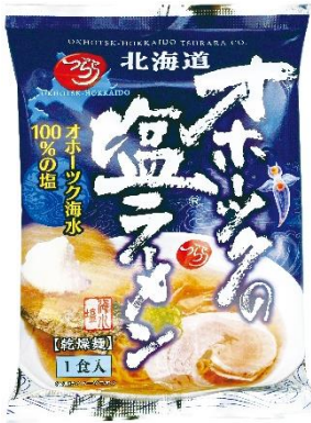
新・オホーツクの塩ラーメン 440 円