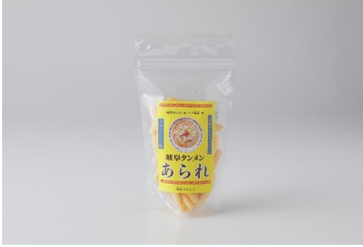
岐阜タンメンあられ(袋) 520円