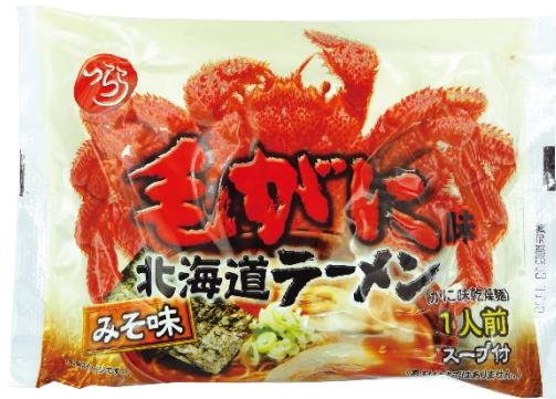
新・毛がに味北海道ラーメン みそ味 380 円