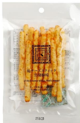
焼チーズスティック黒胡椒味 400 円