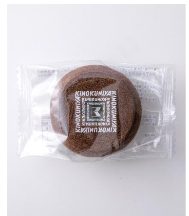
バウムクーヘン(チョコ) 220 円