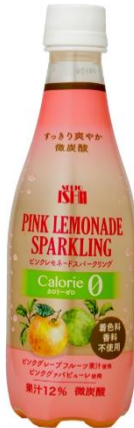
ピンクレモネードスパークリング 190 円