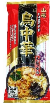
山形鳥中華 そぼつゆ味(2食入) 400 円