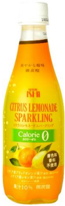
シトラスレモネードスパークリング 190 円