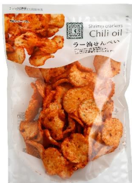
ラー油せんべい 400 円