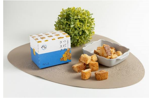
つばめラスク(シュガー、きなこ、あんバター) 各 600円